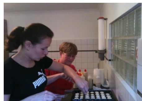
De poffertjes waren heerlijk

Komende koorreis gaat naar Zeeland, Burgh-Haamstede. Je bent reeds geïnformeerd over de hoeveelheid kruisjes en de kosten van de reis. We verzoeken je voor 20 april te betalen. Opgeven mag ook nog steeds.