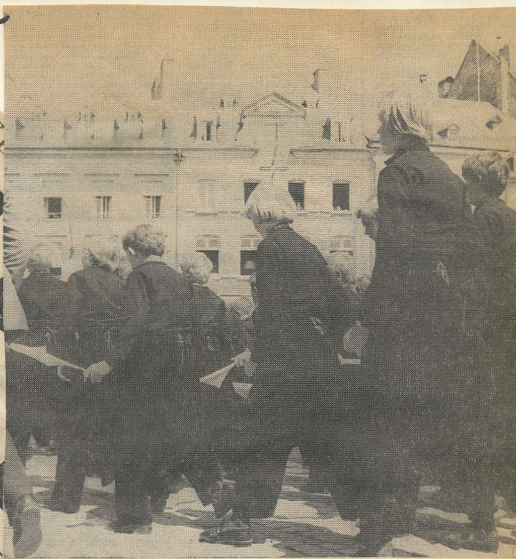
Des participants participent à la procession et se sont mis vite au diapason.